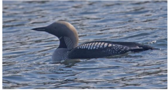
Storlom fotograferad på häckningsplats i Norrland