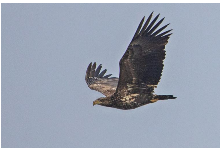
Numera är havsörn en ganska vanlig syn i kommunen. Ung havsörn vid Trolleholm

Här kommer årets rapport om viktiga händelser bland fåglar i Svalövs kommun. Rapporten bygger som tidigare på det som finns rapporterat på Artportalen. Att rapportera sina fynd där hjälper inte bara för att skriva denna rapport utan används också i miljöövervakning och forskning på nationell nivå. Så glöm inte att rapportera dina fynd!