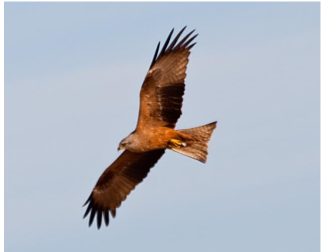
Brun glada blir vanligare i Sverige. Bilden från södra Spanien.