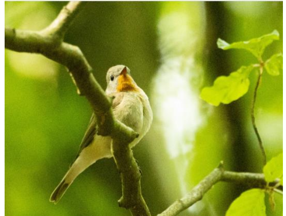
En av de sjungande mindre flugsnapparna vid Jällabjär 250609

Svarthakad buskskvätta Två fynd under hösten gör att det nu gjorts 8 fynd i kommunen. Första fyndet är från 2014 och arten häckade vid Bokholmen 2016. Arten fortsätter att sprida sig i landet och det finns anledning att spana extra framöver!