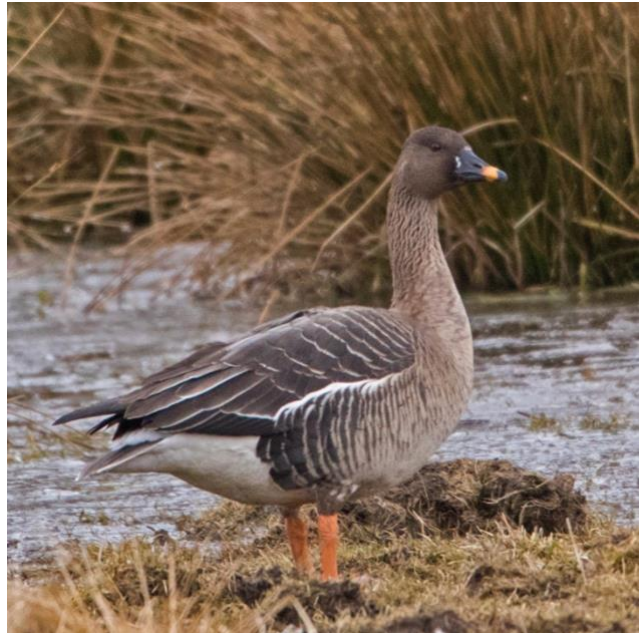
Tundragås fotograferad i Svenstorp på den tiden den "bara" var en tundrasädgås.

Obestämd skogs/tundragås Eftersom splitten av sädgås kom under året har sex fynd rapporterats som obestämda till art. Alla dessa fynd är från årets tre första månader. Man kan anta att det även fortsättningsvis kommer att rapporteras obestämda "sädgäss" då dessa inte alltid är lätta att skilja.