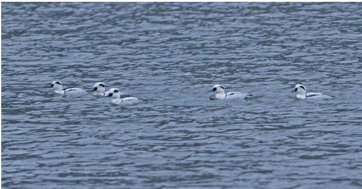
5 av 7 salskrakshananar i Trolleholmssjön den 30/12. Platsen är nog den viktigaste för fynd av arten i kommunen.