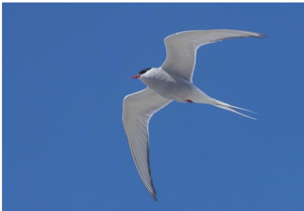
Silvertärna – fotograferad på häckningsplats på Fårö

Silvertärna – Fjärde fyndet i kommunen, det senaste var 2022 också i Bokholmen.