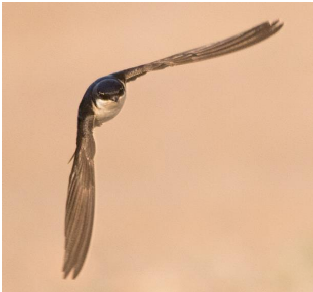
Hussvala vid Bokholmens gård – ett av ganska få ställen med häckande hussvalor i kommunen.

beståndet t ex under flyttning till Afrika.