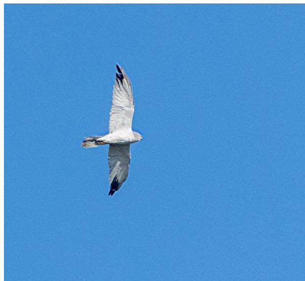
En gammal stäpphökshane är alltid en välkommen syn för varje fågelskådare. Fågeln på bilden är dock tagen vid Skanörs ljung!