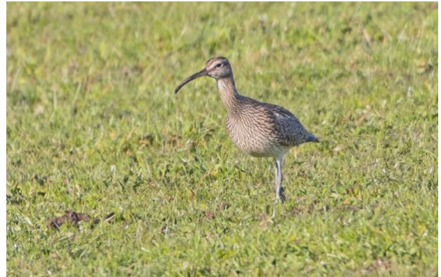
Denna småspov födosökte vid Bokholmen i början av maj.