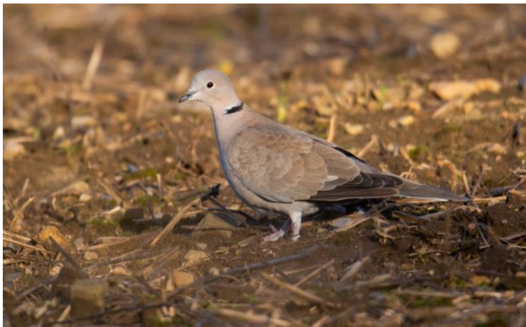
Turkduva vid Gissleberga som är artens starkaste fäste i kommunen tack vare spillsäd.

Turkduva Sedan arten etablerade sig i landet på 1950-talet har den kvar små populationer i tätorter nära människor. Medan det fanns sädes-silos vid stationen i Svalöv kunde det finnas flera hundra individer där. Från AP ser man att det under året funnits enstaka individer i kommunens olika tätorter. Större samlingar finns numera bara vid Gissleberga kvarn med som mest 45 individer 25/1 ( Johan Gustafsson ). Kanske finns andra liknande lokaler i kommunen som inte är rapporterade? Något att kolla under 2024!