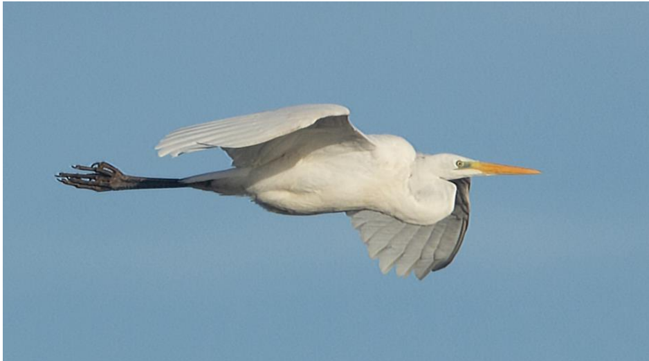
Ett av många fynd av ägretthäger under året – Trolleholm i december.

Ägretthäger Arten fortsätter att öka i Sverige och även i kommunen finns det så många rapporter under året att det är svårt att bestämma antalet fynd. Sammanställer man alla rapporter från tidigare år är höstfynden i stor majoritet medan det t ex bara finns ett enda fynd under juli.