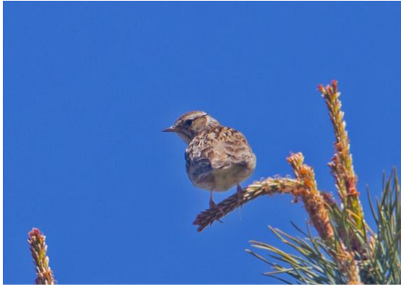
En uppmaning - leta efter den skönsjungande tofslärkan 2024!

Trädlärka Två fynd av sjungande individ i samma område kan indikera häckning och kan vara något att följa upp kommande sommar: