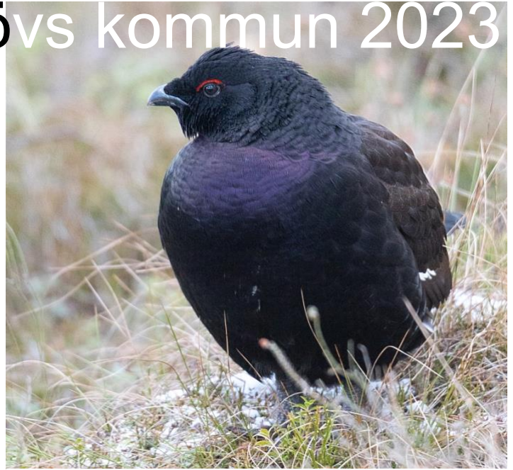
Rackelhane vid Traneröds mosse, februari 2023

Så är det åter dags att sammanfatta det gångna fågelåret. Under 2023 sågs 177 arter i Svalövs kommun vilket är något under snittet för de senaste åren. Naturligtvis är det framförallt den ornitologiska aktiviteten som är för låg för att täcka in alla arters rörelser i hela kommunen. Hoppas att ni alla vill bidra med rapporter på Artportalen under 2024! Behöver ni hjälp med hur man rapporterar så hör av er!