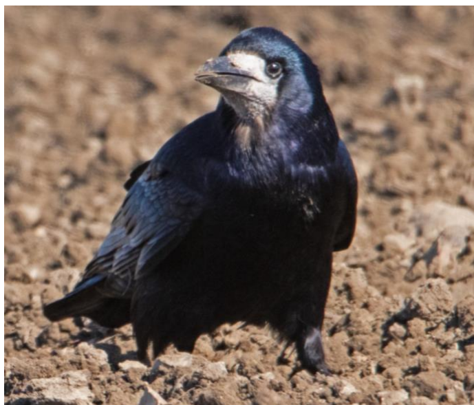
Råkan är ett typiskt inslag i jordbrukslandskapet. Dess vana i att rota i jorden efter föda leder till naken hud runt näbben hos vuxna råkor.