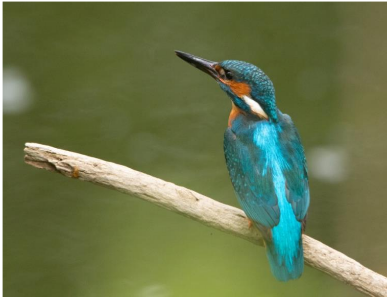
Kungsfiskare på spaning efter föda. Dold lokal Svalövs kommun 20200523

Göktyta. Många rapporter om spel/sång och även andra tecken på att stationära individer uppträtt skyggt men inga säkra häckningsindicer. Arten har en positiv trend som också anas i kommunen.