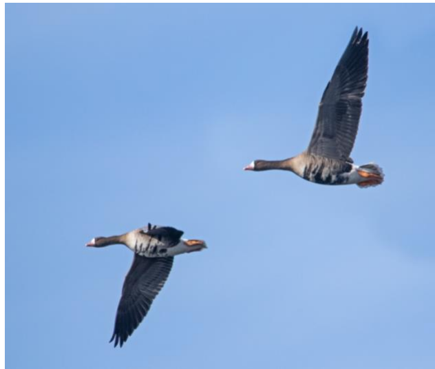
Bläsgäss fotograferade vid Bulls måse 20190324.