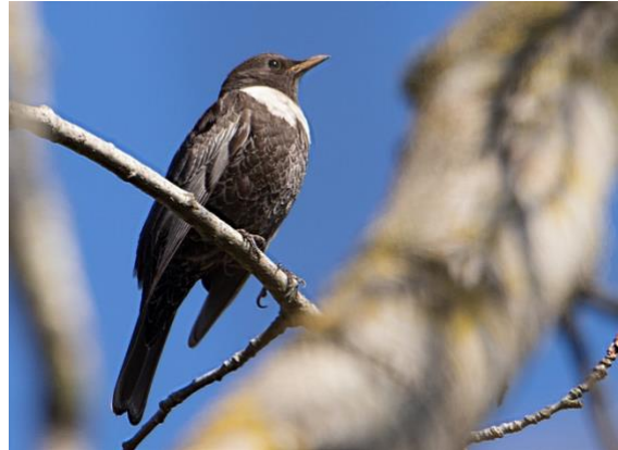
En av ringtrastarna vid Kongaö 20200419

Totalt har därmed 23 fynd gjorts i kommunen. Mönstret är tydligt med de flesta fynden under en kort period när arten sträcker genom landet i april. Bara två fynd är från maj varav årets är det senaste. Ett fynd föreligger sedan tidigare i oktober.