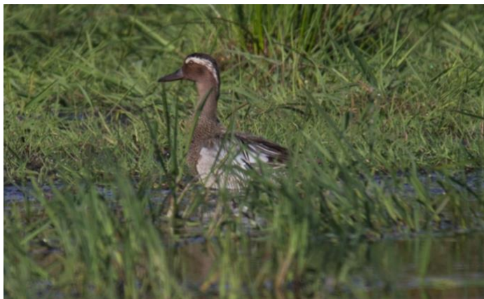
Årta, hane fotograferade vid Bokholmen 20170521.

Mindre sångsvan. Endast få fynd och aldrig mer än två individer under året. Arten är aldrig vanlig men vissa år som 2018 uppträdde stora flockar tillsammans med vanlig sångsvan i kommunen.