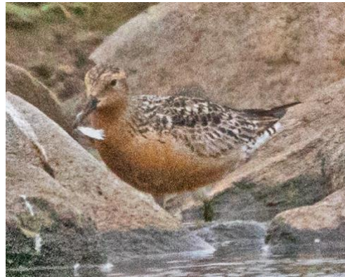
Kommunens första kustsnäppa. Prästafäladen 20200731.