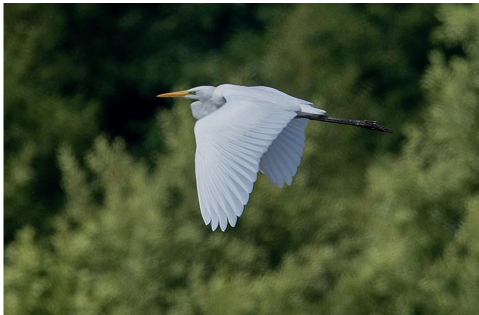
En av många ägretthägrar under året. Bulls måse 20200801.

Vit stork. Inga fynd under året! Vi får fortsätta att vänta på att arten med stöd av storkprojektet ökar i landskapet. När häckar den fritt i Svalövs kommun igen?